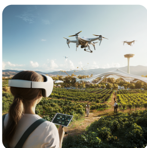
Réponse aux attentes du consommateur : vins bio, vins no-low, œnotourisme