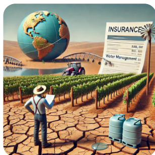
Peu d'innovation technique, vieillissement du matériel et dégradation du sol