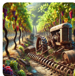
Difficultés des petites exploitations dans la gestion des ressources