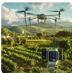
Utilisation accrue des nouvelles technologies pour plus de précision