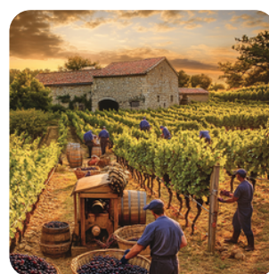
Diminution des emplois et nombre d'acteurs