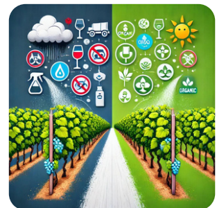
Accompagnement juridique facilité et réglementation assouplie