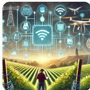
Excellence technique car concentration des acteurs viticoles