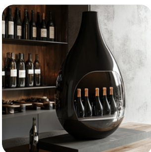
Simplification de l'offre et plus de services