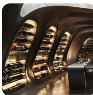
Déconnexion entre production et mise en marché