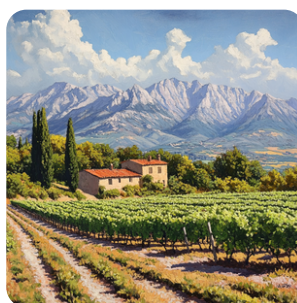
Repositionnement régional du vignoble en altitude