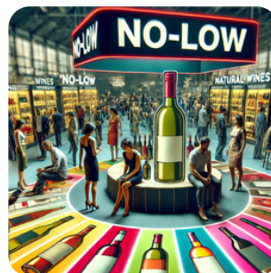
Développement des marques fortes et facilité d'export