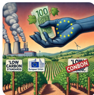
Soutien public limité car l'UE se protège des risques