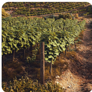
Peu d'innovations techniques et baisse des investissements