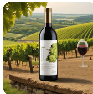
Réponse positive aux attentes sociétales écologiques et au statut culturel du vin