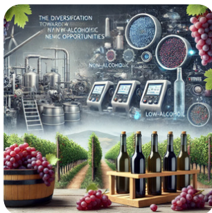
Diversification vers d'autres filières agricoles et vers l'oénotourisme