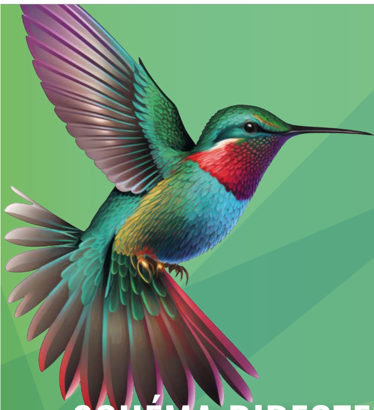
SCHÉMA DIRECTEUR DE LA TRANSITION ÉCOLOGIQUE